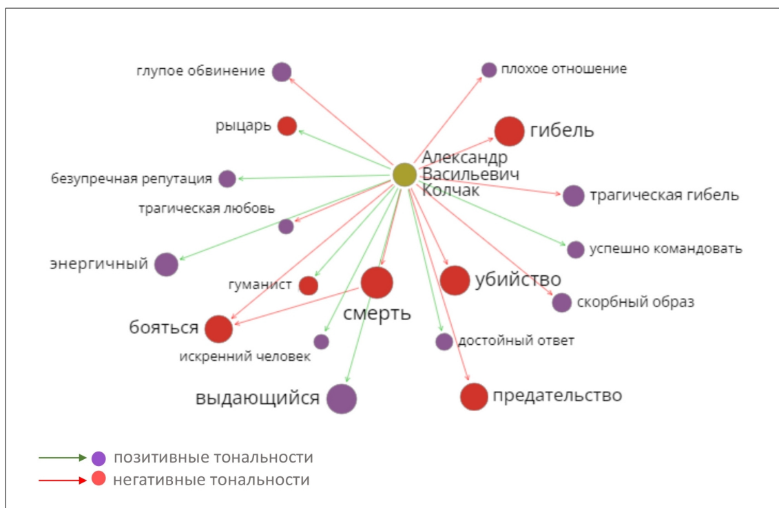
Рис. 4. Граф тональностей объекта «Александр Васильевич Колчак»

А.И. Деникин, напротив, характеризуется довольно однозначно и прямолинейно. Количественно выражение симпатии к нему невелико – пользователи ставят в укор генералу допущенные им ошибки и постигшие его неудачи. При этом П.Н. Врангель, замыкающий пятерку наиболее заметных персоналий, имеет отчетливо позитивную оценку. Авторы