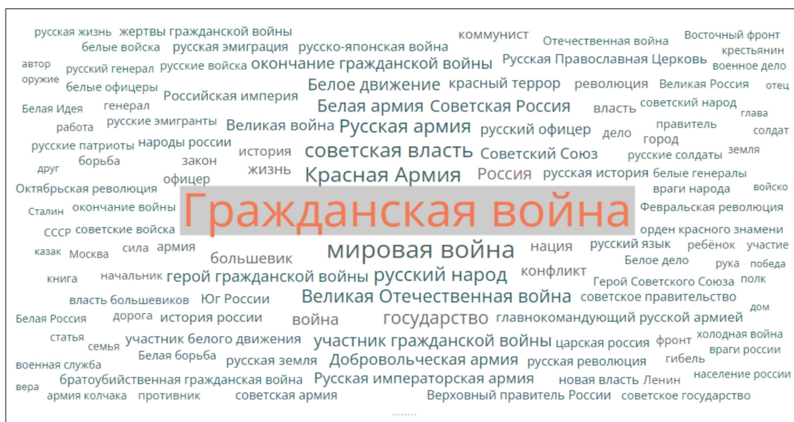
Рис. 1. Облако ключевых слов в постах о Гражданской войне

В облаке ключевых слов заметны не только элементы, очевидно отсылающие к вооруженному противостоянию («Красная армия», «Русская армия», «Белая армия», «Белое движение» и т.д.), но и свидетельства интенсивного припоминания Гражданской войны в контексте непосредственно предшествующей ей Первой мировой, а также последующей Великой Отечественной войны (рис. 1). При этом сама Гражданская война воспринимается в жесткой связке с предваряющими ее революционными событиями (рис. 2). Внутригосударственный конфликт, таким образом, встроен в череду событий, оцениваемых пользователями «ВКонтакте» как наиболее трагичные в российской истории 39 : «Сначала была первая мировая война, далее революция, потом гражданская война. Ни один переворот не решался мирным путем»; «Трагедия гражданской войны не обошла стороной и наше Отечество. Разорвав страну на части в самый разгар Первой мировой войны, гражданская война поглотила каждого русского человека»; «Пожалуй, он застал одну из самых сложных эпох нашего времени. Революция, нищета и голод, гражданская война, Великая Отечественная война, война с Японией, возрождение из пепла, холодная война, СССР в кольце врагов...».