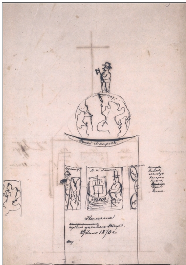
Рис. 2. Эскиз памятника Петру I и пионерам освоения Печорского края, сделанный рукой М.К. Сидорова, 1871 г. (СБбФ АРАН. Ф. 270. Оп. 3. Д. 110. Л. 3)

В мае 1872 г. М.К. Сидоров, получив письмо от барона Ф.Р. Остен-Сакена о планах камергера австро-венгерского двора графа И. Вильчека (рис. 3), учредителя австрийской полярной экспедиции, отправиться к устью Енисея, выразил желание не только оказать содействие экспедиции, но и встретить высокого гостя в устье Печоры. Проведя в пути из Мезени на Печору 21 сутки, М.К. Сидоров прибыл в Печорский порт (Алексеевку). Михаил Константинович встретил иностранных гостей, из-за сложной ледовой обстановки сменивших свой маршрут, на пароходе «Георгий» в Болванской бухте и 24 августа сопровождал яхту «Избьорн» в Печорский порт. Здесь их встречали свыше 100 человек рабочих