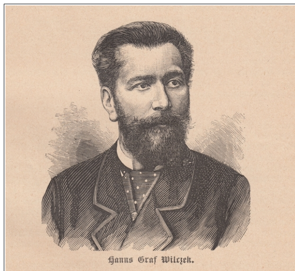
Рис. 3. Граф Иоганн (Ганс) Вильчек.

В 1875 г. англичанин Г. Сибом застал сложный период в истории Печорской компании. Со слов работников, уже тогда было неясно, «будет ли компания принадлежать мистеру Сидорову или мистеру Иконникову, или обоим, или ни одному». Это остается «одной из тех