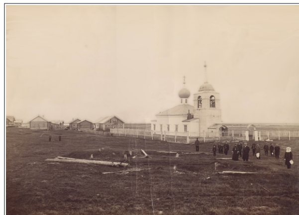
Рис. 4. Церковь в селе Куя на р. Печоре. Фото начала XX в. (Собрание Музейного объединения Ненецкого автономного округа. НКМ КП № 2779)