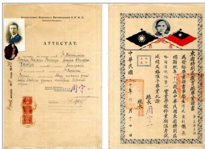
Рис. 3. Аттестат А.Е. Даниеля.

Владимир Васильевич Даниель родился 20 мая 1876 г. В 1895 г. он закончил Орловский Бахтина кадетский корпус, далее поступил в Александровское военное училище. В 1897 г.