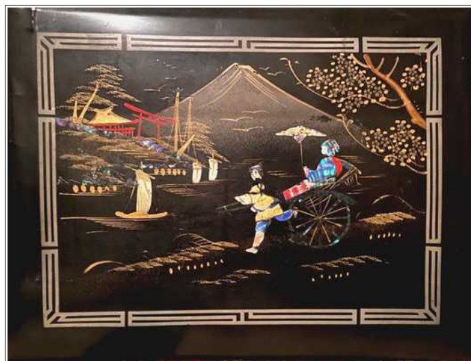
Рис. 4. Лаковый фотоальбом. Источник: семейный архив А.А. Даниель. Публикуется впервые

Источник: ГАРФ. Ф. 10017. Оп. 1. Ед. хр. 122. Л. 2, 3 об. Публикуется впервые