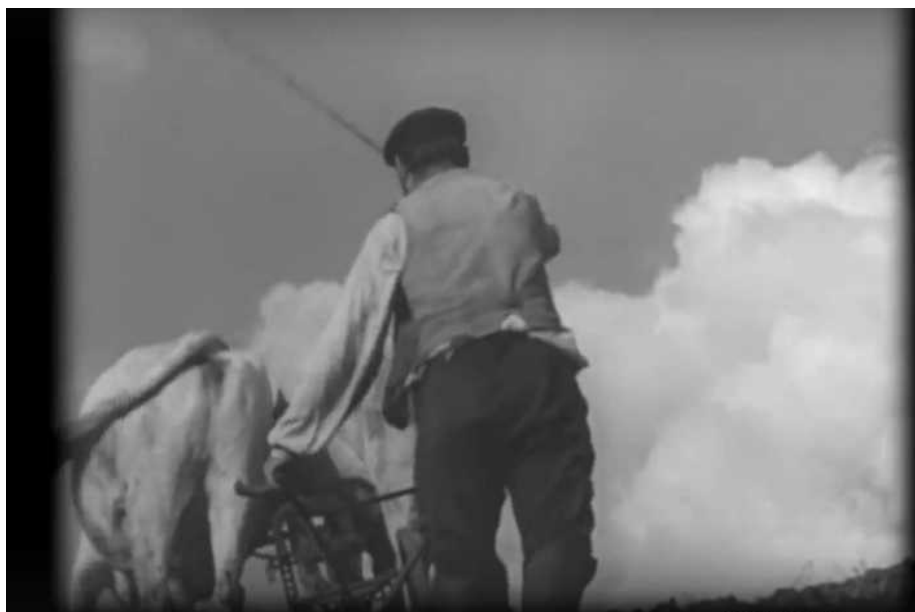
Рис. 1. Отец Василя пашет свой земельный надел (сцена из к/ф «Земля»)

Сюжет середины фильма завязан на сценах прибытия в деревню трактора. Трактор в кино-, фото- и литературных сюжетах 1920–1930-х гг., как правило, выступал в качестве символа, ломающего устройство деревенской жизни. В наших исследованиях, посвященных процессам капитализации сельского хозяйства России в советский период, показано, что проникновение в деревню крупного высокотехнического (на тот период) капитала коренным образом изменяло уклад деревенской жизни 16 . Инициатором приобретения трактора был Василь, а с ним и группа молодых деревенских жителей, которые при большом стечении обитателей деревни (и большом скепсисе селян) доставляют в деревню трактор. Кстати, чтобы трактор приехал, им пришлось, по сюжету фильма, коллективно «очеловечить» его, заправив вместо воды собственной мочой (рис. 2).