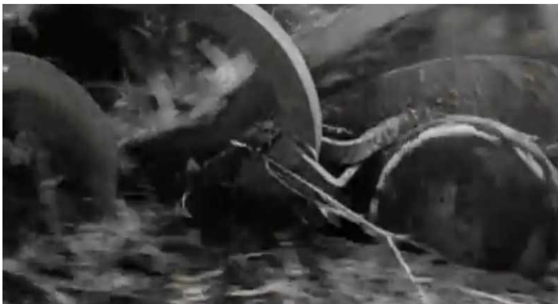
Рис. 3. Сцена перепахивания межи трактором (к/ф «Земля»)