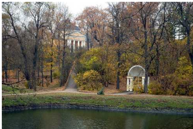
Рис. 3. Государственный Лермонтовский музей-заповедник «Тарханы». Вид на церковь Марии Египетской со стороны Большого пруда

Подчеркнем также, что чем сложнее, разнообразнее и продуманнее была система водоснабжения в усадьбе, тем больший статусный, социальный вес приобретал ее владелец.