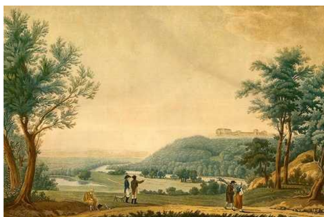
Рис. 4. В.П. Причетников (1767–1809). Вид села Надеждино с восточной стороны. 1790-е гг.