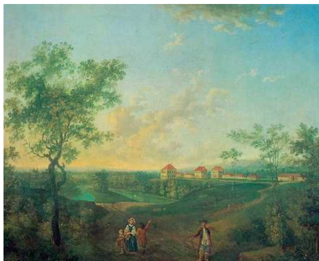
Рис. 5. Я.Я. Филимонов (1777–1795). Вид служебных построек усадьбы Надеждино. 1794 г.