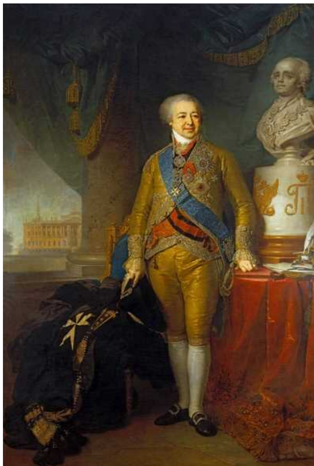
Рис. 10. В.Л. Боровиковский. (1757–1825). Портрет князя А.Б. Куракина. 1802 г.

Сохранилось описание речного круиза, предпринятого в 1786 г. князем А.Б. Куракиным (рис. 10). Он завел у себя в имении винокурный завод и решил самолично проверить путь, которым в Санкт-Петербург доставляется его продукция. С этой целью для первого путешественника по Суре было нарочно изготовлено шестисажженное судно, которое сопровождали две шестивесельные простые шлюпки для служителей, певцов и запасов продовольствия. Вояж князя был обставлен с приличествующими его положению почестями: например, «лестница, по которой он взшел на судно, равно и комната, усыпаны и украшены были цветами, которые так же по дороге перед ним были бросаемы». Сей сиятельный вельможа, утративший фавор императрицы и вынужденный вследствие немилости Екатерины II поселиться в отдаленном своем имении, и в провинциальной глуши пытался следовать нормам и этикету придворной жизни. Его путешествие сопровождалось множеством остановок, приемов и развлечений в усадьбах местной знати и губернской администрации 26 .