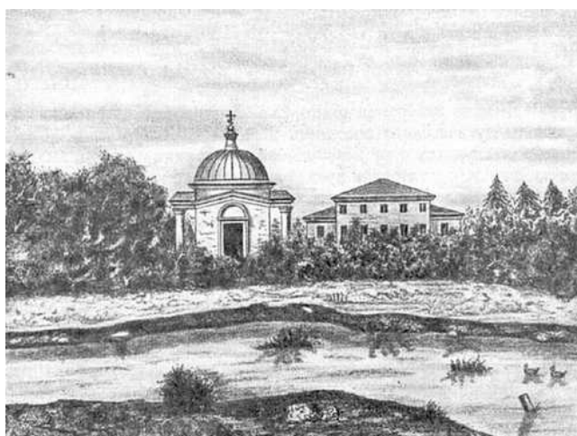
Рис. 2. Тарханы. Вид дома и домово́й церкви. Литография по рисунку М. Рудкевича. 1842 г.