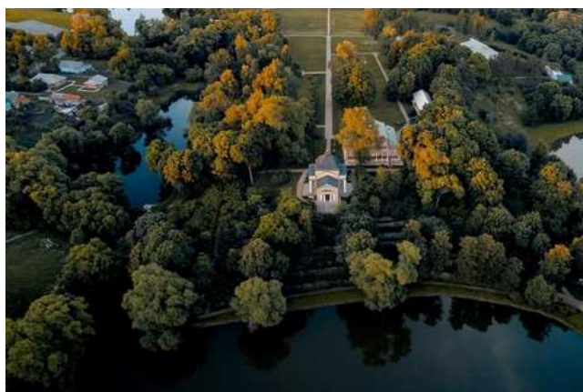
Рис. 1. Государственный Лермонтовский музей-заповедник «Тарханы». Панорамная съемка

Большой пруд в Тарханах служил местом забав и развлечений. Например, зимой, как сообщал в своих воспоминаниях А.П. Шан-Гирей, детский товарищ и троюродный брат поэта М.Ю. Лермонтова, внука Арсеньевых, на льду «мы разбивались на два стана и перекидывались снежными