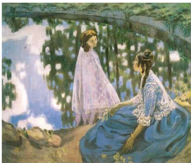
Рис. 8. В.Э. Борисов-Мусатов (1870–1905). Водоем. 1902 г.