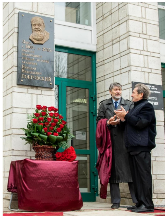
Рис. 1. Открытие мемориальной доски академику РАН Н.Н. Покровскому в Институте истории СО РАН 16 октября 2018 г.

Музеефикация как один из наиболее эффективных и востребованных средств сохранения и актуализации наследия фиксирует память о лидерах науки в мемориальных комнатах, где