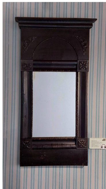
Рис. 5. Зеркало в экспозиции кабинета М.Н. Волконской в Доме-музее Волконских.

После довольно оживленной переписки в августе, особенно со стороны М.П. Волконского, наступает небольшой перерыв, объясняемый обоими корреспондентами занятостью. Но желание