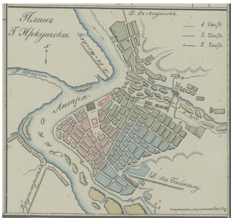
Рис. 1. План г. Иркутска 1828 г. Фрагмент документа.