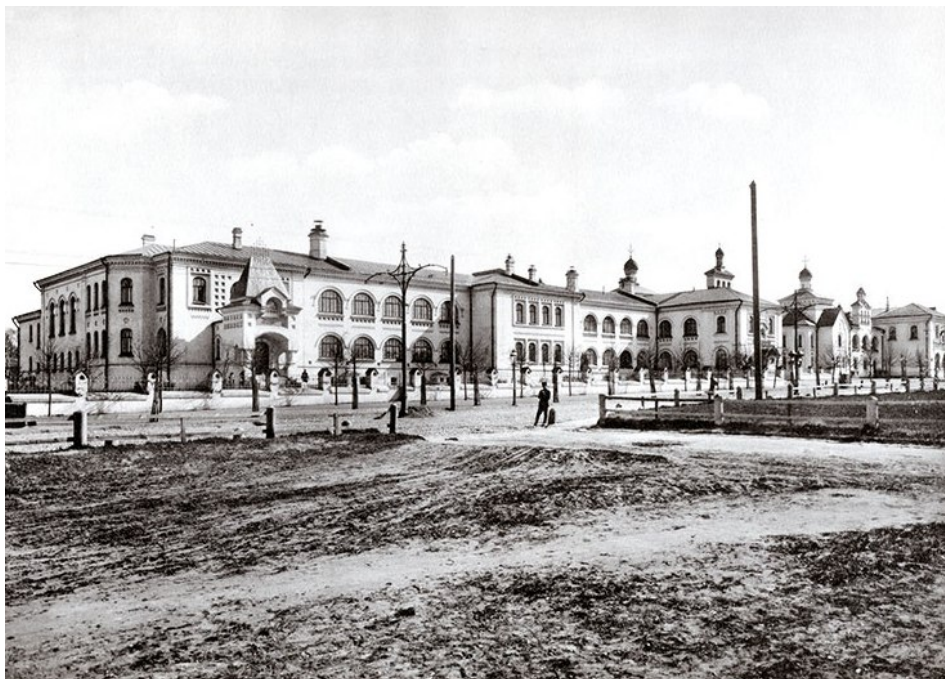
Благотворительный комплекс на Большой Калужской улице. Москва. Фото начало XX в.

Интересно отметить, что назначение жертвуемых А.К. Медведниковой капиталов Иркутску и Москве имело ряд общих векторов. Оба города получили по 100 тыс. руб. «в пользу бедных жителей христианского вероисповедания без различий пола и званий». В столице проценты с данного капитала, составлявшие ежегодную сумму в 5 тыс. руб., раздавались подавшим заявление о бедности в городскую думу трижды в год: на Пасху и в дни памяти И.Л. и А.К. Медведниковых 71 . Аналогичным образом распределялись капиталы и в Иркутске.