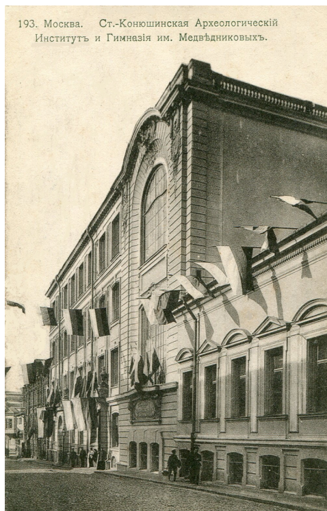
Мужская гимназия имени И. и А. Медведниковых. Москва. Почтовая открытка. 1910-е гг.

Душкин Ю. «...от корабельного морского ходу» // Литературный Иркутск. 1989. Март. С. 14–15.