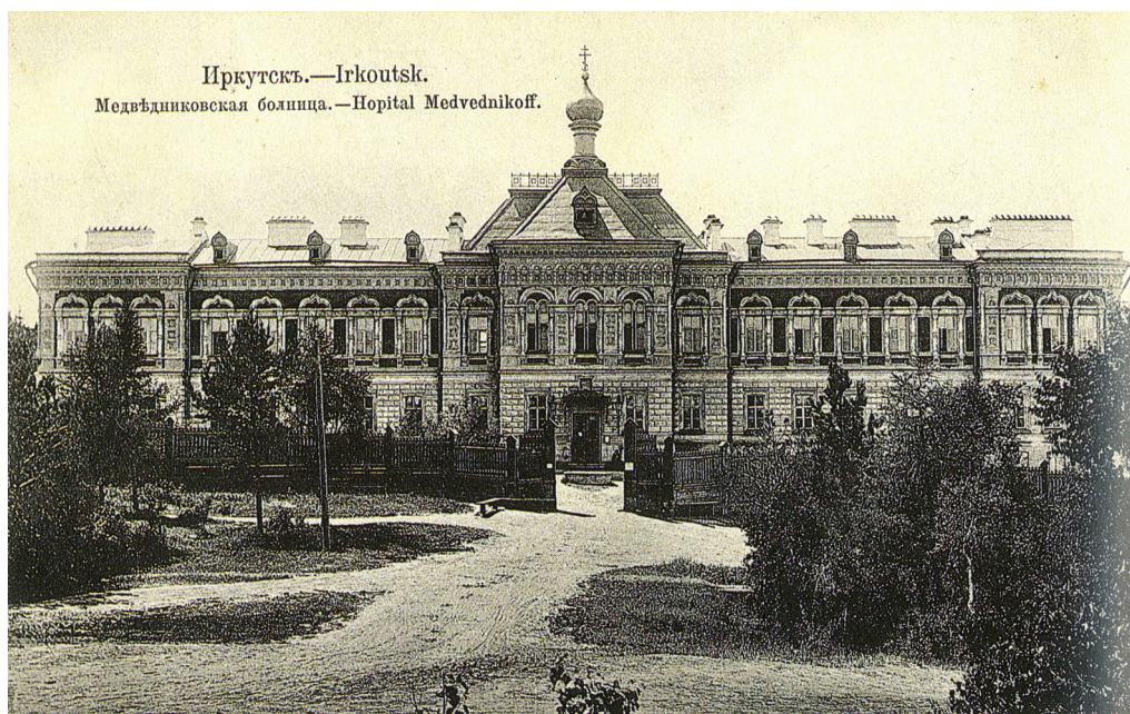
Иркутск. Медведниковская больница. Почтовая открытка. Начало XX в.