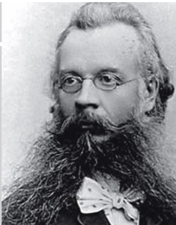
Н. М. Ядринцев

Заметным явлением в истории Сибири второй половины XIX – начала XX вв. стало «сибирское областничество» – общественно-политическое и культурное движение, сторонники которого добивались для своего родного края прав, свобод и возможностей, которыми пользовалось население Европейской России и, вместе с тем, отстаивали идею более самостоятельного, автономного развития Сибири, с учетом ее географических, социально-экономических и культурных особенностей.